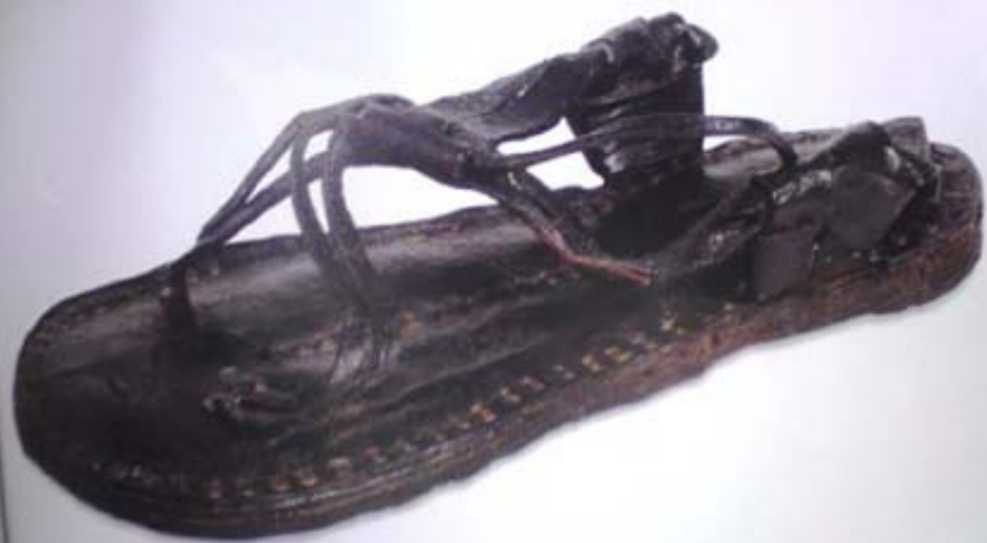
Wooden Sandal T.J. 30. Inv. No. 212/80