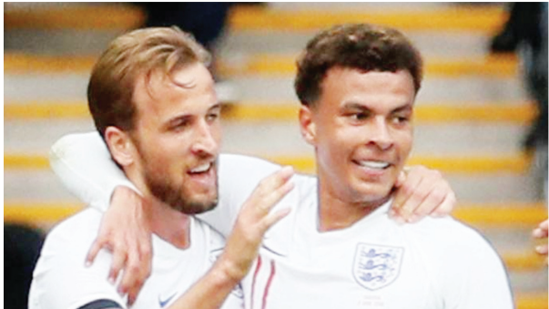
အင်္ဂလန်

အင်္ဂလန်အတွက် ဒီတစ်ကြိမ်မှာ ကမ္ဘာ့ဖလားပြိုင်ပွဲ အုပ်စုအဆင့်မဲကျမှုက အနည်းငယ်အသက်ရှူချောင်သလို ရှိနေပါတယ်။ ဥရောပရဲ့မျိုးဆက်သစ် အင်အားစုကို ပိုင်ဆိုင်ထားတဲ့ ဘယ်လ်ဂျီယံနဲ့ သူတင်ကိုယ်တင် ယှဉ်ရမယ့်အခြေအနေမျိုး ဖြစ်နေပေမယ့် ပနားမား၊ တူနီးရှားစတဲ့ ပြိုင်ဘက်တွေကိုတော့ အင်္ဂလန် ကျိန်းသေအနိုင်ယူနိုင်ရမှာပါ။ ၂၀၁၄ ကမ္ဘာ့ဖလားပြိုင်ပွဲတုန်းက အုပ်စုအဆင့်နဲ့တင် ကျေနပ်လိုက်ရတဲ့ နာမည်ကြီးထမ်းငတ်အဖြစ်မျိုး မဖြစ်ရလေအောင် အင်္ဂလန် စွမ်းဆောင်ပြနိုင်လိမ့်မယ်လို့ အကောက်အယူပြုမိပါတယ်။