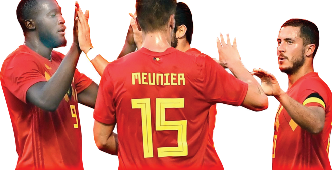
ဘယ်လ်ဂျီယံ

အင်္ဂလန်အတွက် ဘယ်လ်ဂျီယံနဲ့ပွဲစဉ်ကသာ အကျပ်အတည်း တစ်ခြစ်ဖို့ ရှိနေပါတယ်။ ပနားမားနဲ့ တူနီးရှားတို့ဆိုတာက အင်္ဂလန် စာဖွဲ့လောက်စရာ ပြိုင်ဘက်မျိုးတွေ မဟုတ်ပါဘူး။ အိမ်ပြည့်အဆင့်သာရှိတဲ့ ပနားမားနဲ့ တူနီးရှားတို့ဟာ အရှက်တကွဲဖို့ပြတ်ရလဒ်တွေနဲ့ မရှုံးရင်ဘဲ ကျေနပ်ကြရပါလိမ့်မယ်။ အင်္ဂလန်နဲ့ ဘယ်လ်ဂျီယံတို့နဲ့ပွဲစဉ်မှာ ရလဒ်ကောင်းတဲ့အသင်းက အုပ်စုဗိုလ်နေရာကိုရယူဖို့အခွင့်အလမ်းသာ သွားမှာပါ။